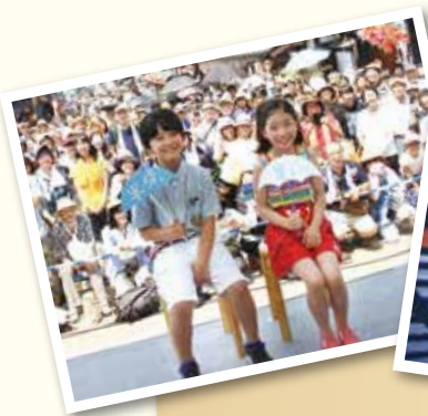
8月5日、第5回ふくろうまつりでのトークショー