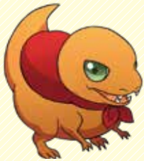
アロちゃん(アロサウルス) いつか岐阜県の観光大使になるため現在県博物館で勉強中。

当館には次のような人気キャラクターがいて、展示解説や広報などで大活躍をしています。県民の皆様をはじめ多くの方々には、このキャラクター共々当館に一層親しみを感じ「また来よう」と思っていただけのように、職員一同精一杯努めてまいります。引き続きご支援を賜りますようお願いいたします。