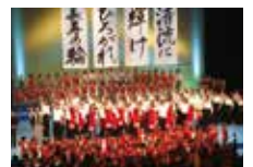
「がんばろう三唱」をする関係者ら