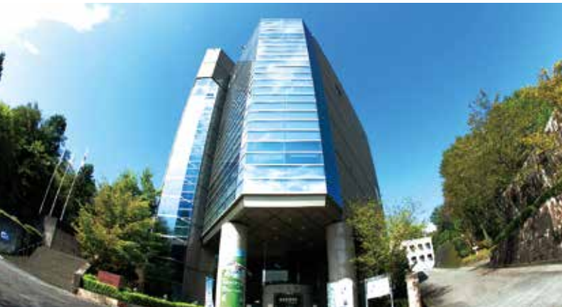
エントランス外観