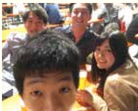
プライベートでの写真(飲みに行ったり、中ドラゴンズを応援したり)