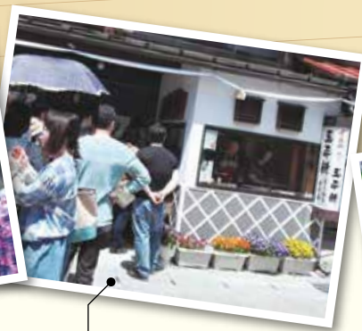
鈴愛の漫画の師匠秋風羽織が「真実の食べ物」と絶賛した五平餅はどの店も客が行列を作り、早めに売り切れてしまう。五平餅人気は全国的なものとなった。