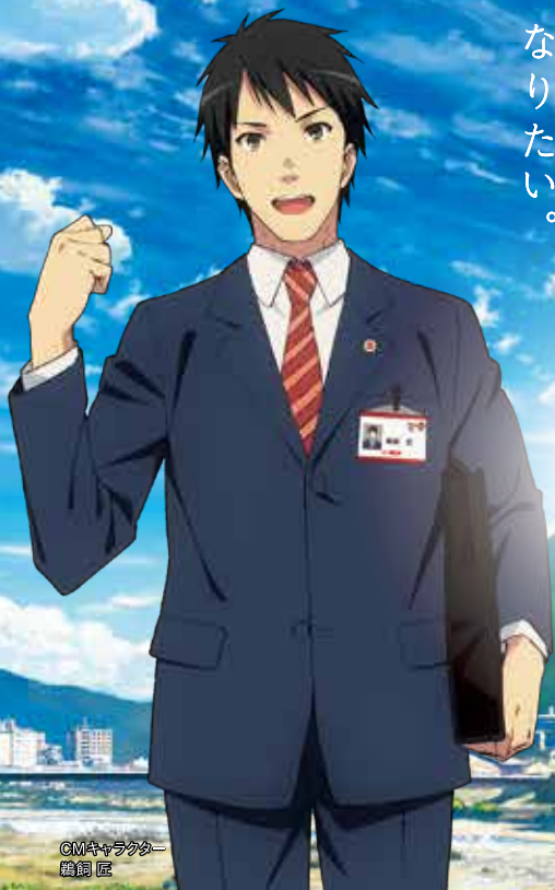
CMキャラクター 繪銅 匠