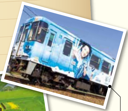
恵那と明知を結ぶ明知鉄道のラッピング車両。一日13、4往復と本数が少なくそのうちの数本なので遭遇できるチャンスは少ない。間近で見ると大きさに圧倒される。