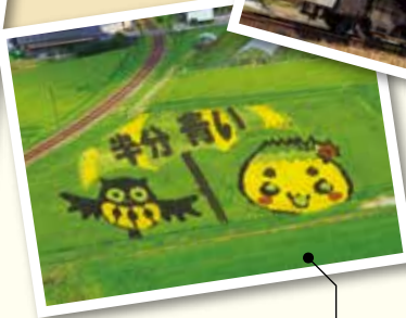
隣町山岡町の田んぼアート。地域の人たちや企業が力を出し合って毎年企画している。今年は「半分、青い。」