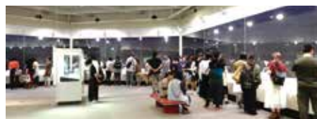
にぎわう特別展示室の様子

関の刀鍛冶の中で初めて受領名を許された名工・和泉守兼定。新選組副長・土方歳三の愛刀を含め全国から兼定銘の刀剣が一堂に会した本展には、全国から約2万人もの来館者があり（※）大変にぎわいました。いわゆる「刀剣女子」と呼ばれる若い女性層の愛好家も