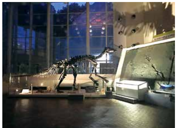
ライトアップされたイグアノドンが参加者をお出迎え

毎月第2、第4日曜日の午後を中 心に体験教室を開いています。「化石 レプリカ」「化石取り出し」「万華鏡 「どんぐり標本箱」「隕石探し」「化石 掘り出し」「水晶ジオード割り」など 定番の人気メニューに加え、「組紐 ストラップ」「紋切り遊び」「香り袋」