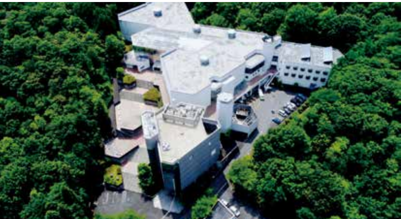
緑に囲まれた里山の博物館

今年5月11日には、開館以来の入場者数が300万人を超えました。今後ますます県内外の関連施設との活発な連携を図って本県の中央博物館としての役割を果たすとともに、利用者が知的好奇心を満たし、探究心や創造性を開発できるような生涯学習機関として地域に貢献できるよう努めてまいります。