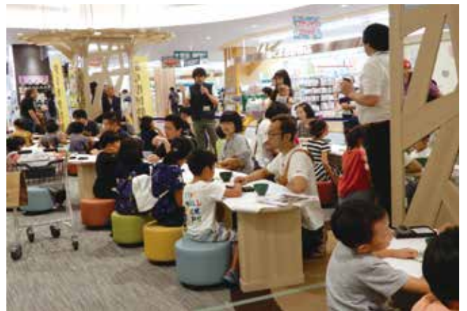
近隣の大規模商業施設で開催しているワークショップの様子

当館から遠くにお住いの県民や普段来館数の少ない若年層の皆様にも、当館の文化的財産を享受する機会を提供するために、館外での展示や催し物を実施しています。昨年度より近隣の民間商業施設を会場として子