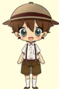
博くん(ホモサピエンス) 小学5年生で探検好き。今年の目標は友達1000人作ること。