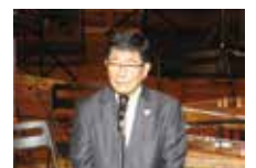
あいさつをする古田知事