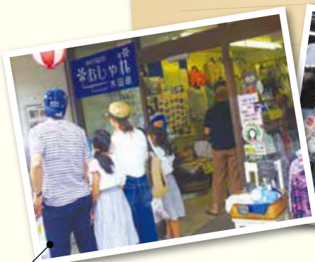
鈴愛の幼馴染ナオちゃんの実家、「おしゃれ木田原」の撮影地「やすだや」さん。店内の様子はほぼそのまま使われた。店頭には撮影当時の写真などが展示してあり、訪れる人は多い。

もともと岩村町は「女城主の里」として古い町並みを訪れるファンがそれなりにありましたが、平日は町を歩く人を見かけることはほとんどありませんでした。ところが今は平日でもそこそこ人通りがあり、大手旅行会社のバスツアーも組まれているようです。9月のフィナーレまであとわずか。ブームが去ったあと、ドラマに惹かれて来たお客様の何割かでも歴史の町岩村へ再訪していただければいいなと思います。