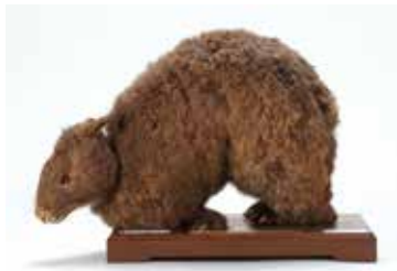
現在は絶滅危惧種であるアマミノクロウサギの剥製 (多治見高等学校旧蔵)

動物標本を中心に、大学や高等学校 が所蔵していた戦前の貴重な標本のほ か、博物館が研究のために所蔵する多 数の標本を展示し、生物標本の面白さ や岐阜の多様な自然のすばらしさを紹 介しました。小・中学校の夏休み期間 とも重なって多数の子どもたちの来館 もあり、自分の体よりも大きいタイリ クオオカミやイリエワニなどの剥製に 触って楽しんだり、種類によって異な る標本の作り方や作る意義を学んだり、