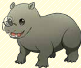
デモスさん(デモスチルス) 泳ぎが得意。趣味は貝殻採集と歯磨き。デモスチルスは歯が命。