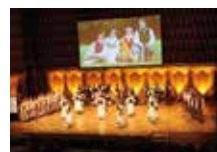
リトアニア伝統の歌と踊り、民族楽器の演奏が披露されました

このほか、岐阜駅のアクティブG内「THE GIFTS SHOP」では、シンプルで美しいリトアニアの伝統工芸品が展示・販売されたほか、各所で写真展やセミナーなど関連イベントが開催されました。