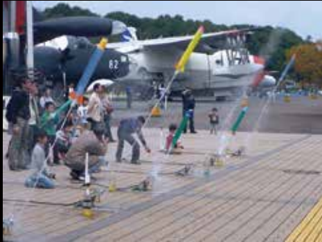
水口ケット体験教室の様子

このほか、小学校の校外学習で利用していただくため、学習カリキュラムを基に独自の教材を開発し、事前学習、見学、事後学習を組み合わせた教育プログラムも開始する予定です。