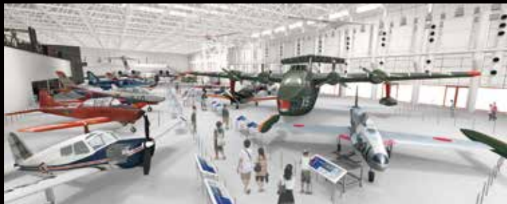
A3ゾーン(実機展示場) CG

現存する「三式戦闘機『飛燕』」の実機(本物の機体)と、各務原飛行場で初飛行した、世界的名機「零戦」の試作初号機(名称:十二試艦上戦闘機)の実物大模型を展示。零戦初号機は、細部の形状も塗装も不明な点が多かったのですが、今回、わずかに残る当時の資料と著名な研究者による監修を受けて、原型を忠実に再現しました。