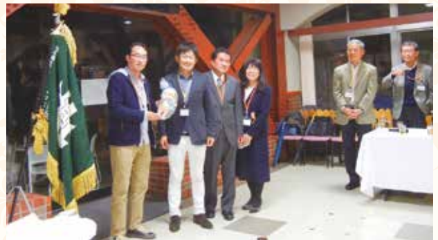
恒例となっている次回幹事回生への「マスコット人形」の引き継ぎ