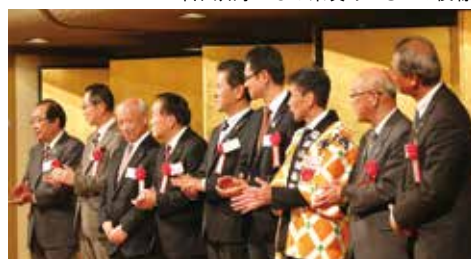
ご来賓の市町村長他の方々