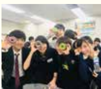
ゼミのプレゼン後 (右から2番目)