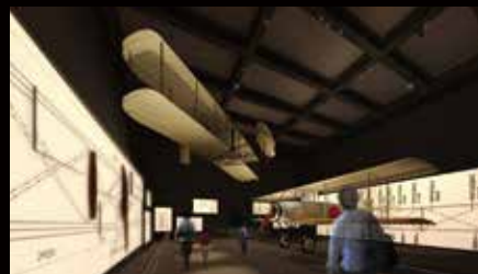
ライトフライヤーとサルムソン CG

ここでは、人類が初めて空を飛んだ動力航空機「ライトフライヤー」(実物大模型)と日本で初めて量産された航空機「乙式1型偵察機」サルムソン2A2(復元機)が皆さまをお迎えします。