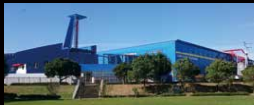
岐阜かかみがはら航空宇宙博物館

ら約20年が経過するのを機に、県も参画して思い切ったリニューアルを行うことを決めました。