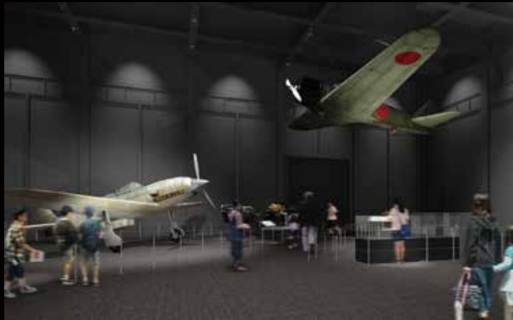
飛燕と十二試艦上戦闘機CG

1997年の開館以来20年余を経て待ちに待ったリニューアルオープンをした岐阜かかみがはら航空宇宙唯一の航空宇宙の専門博物館に、国内最多の43機を展示、国内外の航空宇宙機関との連携により、大変わった「そらはく」をじっくりとご紹介しよう。