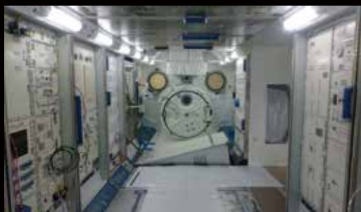
ISS日本実験棟「きぼう」

アメリカのアポロ計画や旧ソ連のルナ計画など、月へ挑んだ歴史、スペースシャトル、そして現在、世界の宇宙開発の舞台となっているISS（国際宇宙ステーション）などを紹介いたします。なかでも