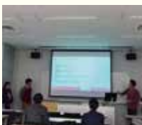
ゼミでのプレゼンの様子 (左)

て頂き、貴重な時間を過ごせました。大学生になるとクラス単位での活動が減り、良くも悪くも共に過ごす友人を選ぶことができます。それはそれで楽しいのですが、意図せず、自分で選んだコミュニティの仲間と、狭い範囲の似た会話をしてしまいがちです。また、SNSが発達し、自ら検索した情報や検索内容に基づいておすめされた情報を得ることが増え、自分が知らない分野との出会いが少ないのも現状です。寮では、様々な学年の人から今まで触れてこなかった分野、趣味の話や検索機会も増え、自身の興味や行動の幅を広げることができたのではないかと思っています。寮を通して、県人会の方々とお食事する機会もあり、同世代と話すだけでは得られない刺激も頂きました。 たった1年間ではありましたが、たくさんのご縁と広く深く養った好奇心は、今後の生活をより豊かにしてくれるのだと感じています。これからも貪欲に学ぶ姿勢を忘れず、社会で活躍できる人になりたいと思います。