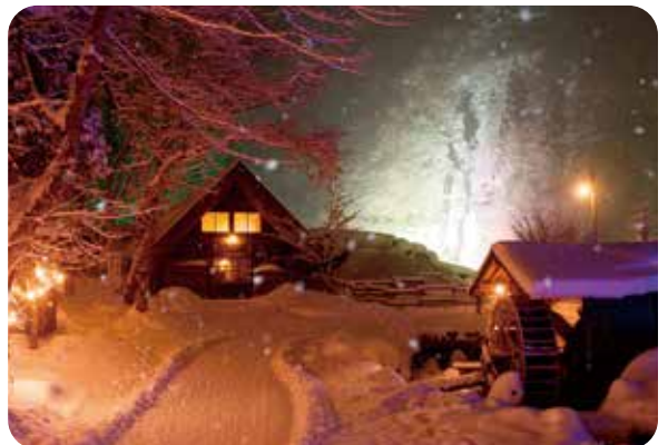
タルマかねこおりライトアップ(高山市)