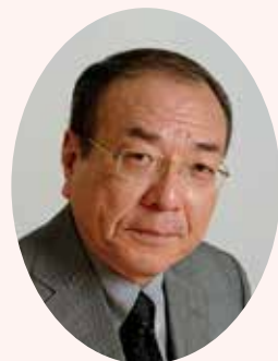
東京岐阜県人会会長