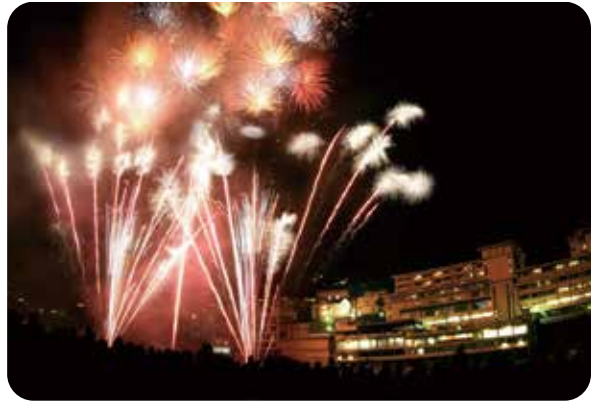
下呂温泉花火ミュージカル冬公演(下呂市)