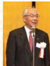
中津高校関東OB会で挨拶する青山市長