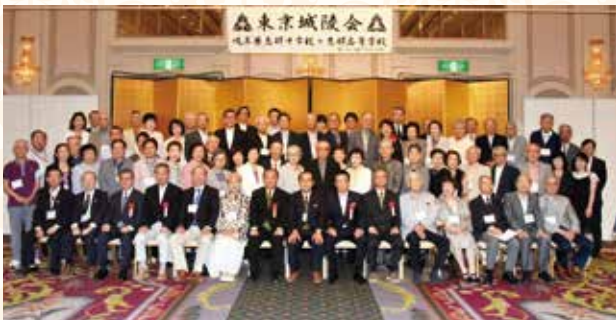
出席者の記念写真