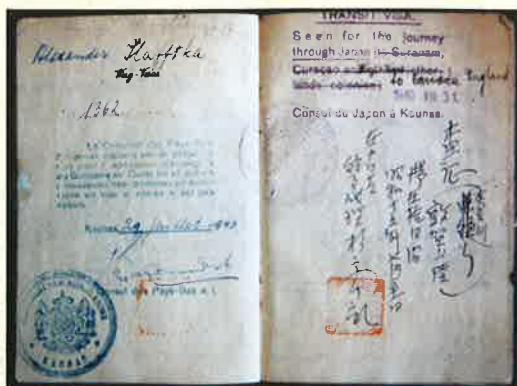
杉原の手書きビザの記載のあるパスポート