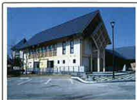
杉原千畝記念館 岐阜県加茂郡八百津町八百津1071 TEL:0574-43-2460