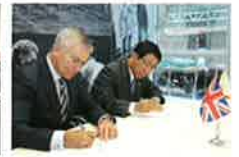
英国オリンピック委員会との連携に関する覚書締結式