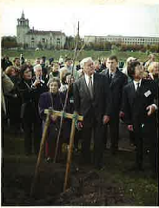
リトアニアでの記念植樹

実はこれは、杉原が一九八五年一月十八日、イスラエル政府より日本人として初めて、かつ唯一の「ヤド・バシエム賞」(ヤド・バシエムはエルサレムにあるホロコースト記念館)を受賞し、「諸国民のなかの正義の人」に列せられた際に、受賞メダルに刻まれていたことばだった。よく杉原は「日本のシンドラー」などともいわれるが、「オズカー・シントラーは確かに多くのユダヤ人の命を救ったが、当初は彼らを自らの工場で強制労働させていたのも事実。一方、杉原の行為は純粹に人道的なものだった。」と、杉原の自らを犠牲にした無償の行為をより高く評価するユダヤ人も多い。エルサレム郊外のベト・シエメシュの丘には彼の顕彰碑が建っている。ヤド・バシエム賞の受賞の年には記念植樹祭と顕彰碑の除幕式が行われたようだ。杉原はその翌年、八十六歳で亡くなった。