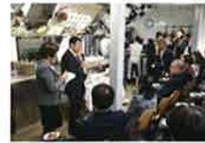
パリの有名料理学校「ル・コルドン・ブルー」での飛騨牛紹介イベント

10月30日(金)から11月9日(月)まで、古田知事は、フランス、スイス、イギリスにおいて、飛騨牛や美濃和紙のPRと東京オリンピックの事前合宿誘致に向けたトップセールスを行いました。