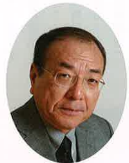
東京岐阜県人会会長