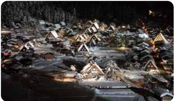
合掌造り集落ライトアップ(白川村)