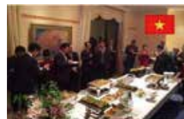
駐ベトナム大使公邸での岐阜県観光・食・モノPRレセプション