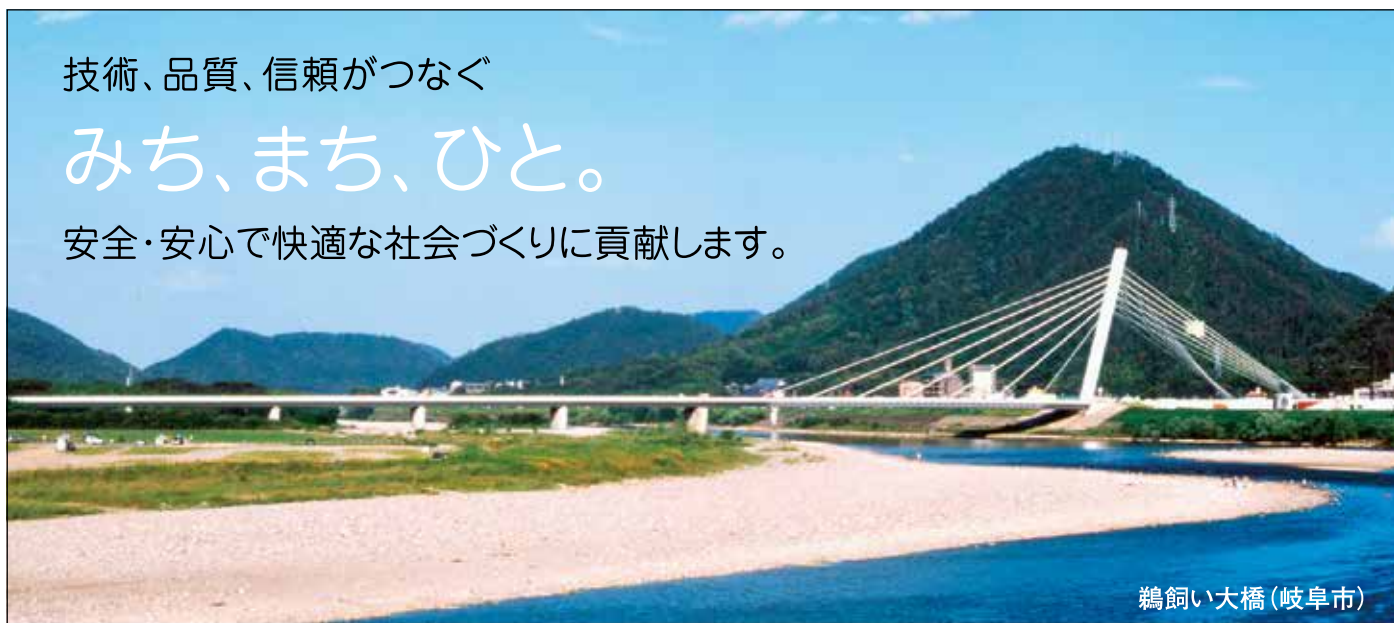
鶺鴒い大橋(岐阜市)