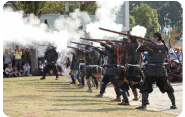
関ヶ原合戦祭り(関ヶ原町)