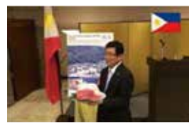
駐フィリピン大使公邸での岐阜県PRレセプション「Feel Gifu」

インバウンドの推進と飛騨牛の本格輸出に向けたPR、自治体間経済交流の促進などについて大きな成果が得られました。