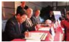
<フランス>オ＝ラン県との経済・ 観光に関する協力覚書締結式