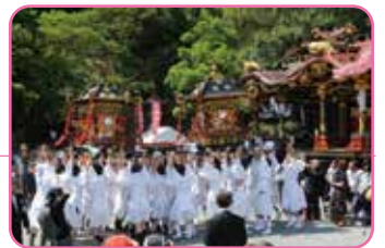
左から、 奥の細道むすびの地「舟下り芭蕉祭」 揖斐まつり