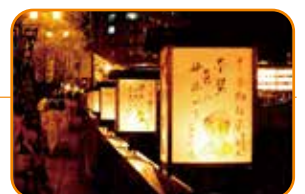
下呂温泉いでゆ夜市