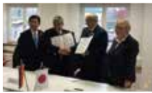
<ドイツ>ロッテンブルク林業単科 大学と県森林文化アカデミーとの 人材・学術交流に係る覚書締結式

またドイツでは、エネルギーと森林・林業分野での連携を進めるため、関係学校間の連携締結式への立合や関係大臣との面談などを行いました。