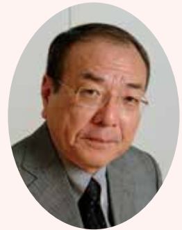
東京岐阜県人会 会長