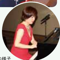
前年度懇親会の様子