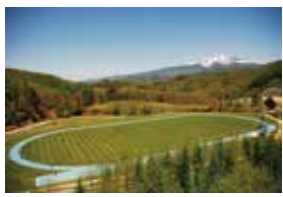
日和田ハイランド陸上競技場