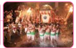
左から、美濃まつり 岐阜城パノラマ夜景 神戸山王まつり