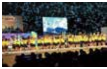
ミナモダンで会場を盛り上げる園児達

平成18年の「全国植樹祭」、平成22年の「全国豊かな海づくり大会」、そして昨年の「ぎふ清流国体・ぎふ清流大会」を経て、県民の皆さんに「清流の国ぎふ」の誇りや愛着が育まれました。その成果を末永く後世に引き継ぎ、本格的な「清流の国ぎふ」づくりへと繋げるため、10月19日・20日岐阜メモリアルセンター、長良川公園において1周年記念イベントを開催しました。