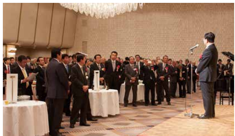
岐阜県の今後の展望をお話する古田知事

懇親会には、昨年を上回るほどの会員をはじめ、国会議員、地元市町村長など多くの来賓の方にもお越し頂き、総勢250名を超える盛大な会となった。宴は、渡辺真岐阜県議会議長の乾杯で始まり、暫く会食懇談を行った。今年のゲストは、