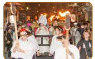
左から、下呂温泉まつり きつね火まつり