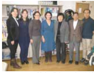
GCSOのスタッフ(中央が代表、その右が筆者) 2012/12/27筆者撮影

そんな折「持続可能な発展のためのジェンダー・センター(Gender Center for Sustainable Development)」(GCSO)を訪問しました。そしてこれが作られてきた経緯と活動の歴史を聞いて衝撃を受けました。