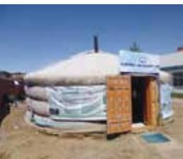
TCDCの拠点ゲル(円形テント) 右後方は区役所 2013/5/29筆者撮影

NGOを2004年に発足させ、環境保護・改善活動を支援してきました。ここで重要視されたのが、「住民の意志による参加」ということです。行政ともタイアップしたさまざまな取組がなされており、モンゴルで唯一、草