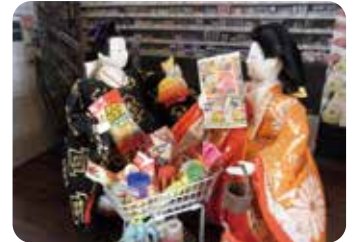
郡上八幡城下町のおひなまつり(郡上市)