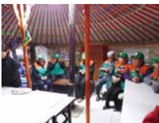
揃いの服を着たエコクラブのメンバー TCDCのゲルの中で 2013/5/31

社会であることは、もはや誰の目にも明らかです。問題はそれをどう打ち破り、新たな普遍的価値をどこに求めるかです。モンゴルの女性たちは私に、大いなる示唆と希望を与えてくれました。