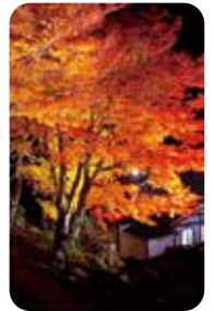
温泉寺周辺紅葉ライトアップ(下呂市)