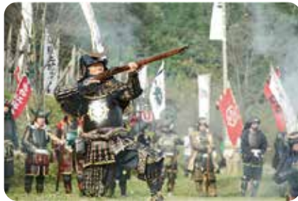
関ヶ原合戦まつり(関ヶ原町)